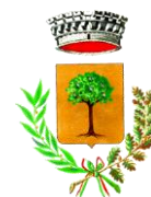
Comune di Loceri