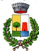
Comune di Bari Sardo