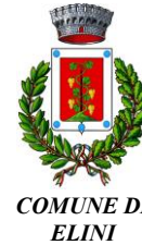
COMUNE DI ELINI