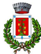
Comune di Elini