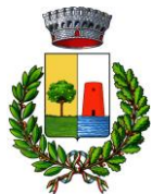
Comune di Bari Sardo