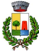
Comune di Bari Sardo