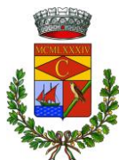
Comune di Cardedu