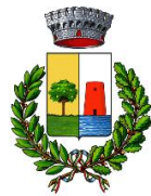
Comune di Bari Sardo