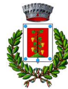
Comune di Elini