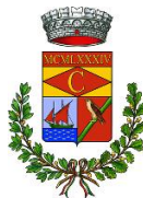
Comune di Cardedu