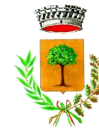
Comune di Loceri