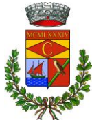
Comune di Cardedu