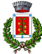
Comune di Elini