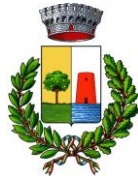
Comune di Bari Sardo