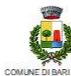
COMUNE DI BARI SARDO