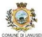
COMUNE DI LANUSEI