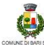
COMUNE DI BARI SARDO