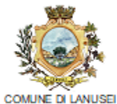
COMUNE DI LANUSEI